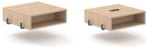
Tisch mit oder ohne Steckdose