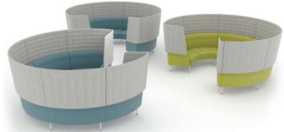
Separate Treffpunkten in offenen Lern- oder Arbeitslandschaften