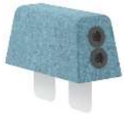
Armlehne mit zwei Steckdosen