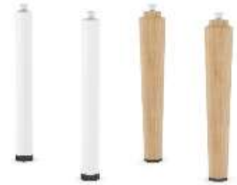
Satz von Beinen (2 St.)

Muss für jede Verbindung zwischen den Sitzsegmenten bestellt werden