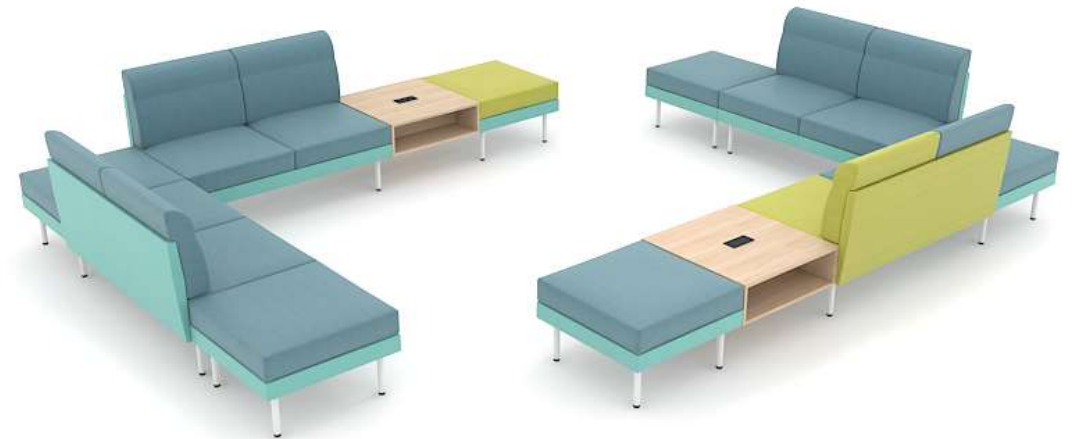
Rezeption und Wartebereiche