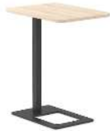
Mobiler Tisch MOBI