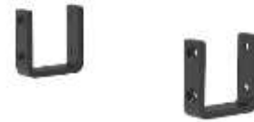
Verbindungswinkel (2 St.)

Muss für jede Verbindung zwischen den Sitzsegmenten bestellt werden